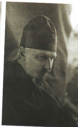
Схиархимандрит Игнатий (Лебедев).